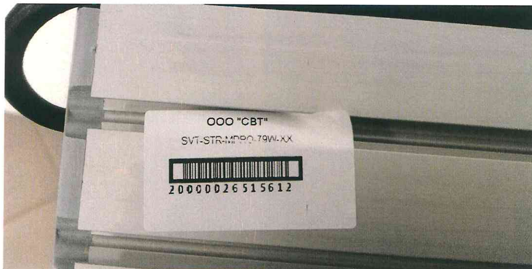
Рис.1 Фотографии образца